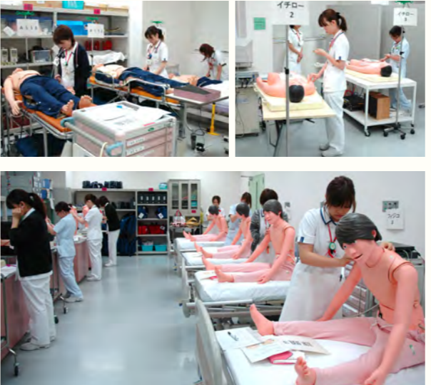
テストに臨む4月に入職した新人看護師

★評価の方法と運用 呼吸・循環のフィジカルアセスメント技術の評価は、「フィジコ」「イチロー」「ラング」などのシミュレーターを使って行い、とくに評価テストの前にはスタッフが入念にシミュレータの機能をチェックしています。アウトカム達成度の評価方法は、実技では9問中9問正解、知識テストでは15問中12問をクリアすると次に進むことができます。テストに合格するまでは何度でもトレーニングを繰り返すことができ、合格に至るトレーニング回数の平均値などもデータ化しています。加えて、症例によるレベル達成度の違いや、達成後もその能力が維持できるかについてもデータ化を試みています。